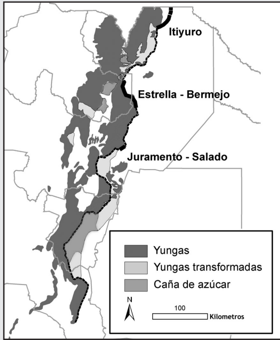
Figura 2. Zona de contacto entre las Yungas y el Chaco. La línea de puntos muestra las áreas antropizadas, mientras que la línea de trazo continuo muestra las áreas donde se mantienen corredores de vegetación natural.

Este proceso está produciendo, por primera vez en la historia de la ecorregión, la desaparición de áreas de contacto con la región chaqueña. La conexión actual representa alrededor del 16% de la longitud original de principios del siglo pasado (en efecto, la longitud de contacto original era de 1.035 km, mientras que la longitud actual es de 162 km). En relación con esta situación, surge la necesidad de saber en qué medida la biodiversidad de las Yungas depende del contacto con Chaco, especialmente para las especies de distribución geográfica y las áreas de acción amplias, como los grandes mamíferos (tapires, chanchos del monte, tigres) y también para especies que, como los loros, basan su estrategia de alimentación y reproducción en grandes desplazamientos diarios y estacionales. Esta cuestión es muy difícil de responder y, lamentablemente es posible que se conozca la respuesta una vez que el proceso sea ya irreversible. De esta forma, se hace imprescindible la implementación de corredores Yungas-Chaco que aseguren la continuidad espacial entre ambos ecosistemas en los pocos sitios en donde aún sea posible hacerlo.